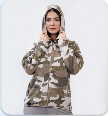
Guerrilla Design Polar Jacket