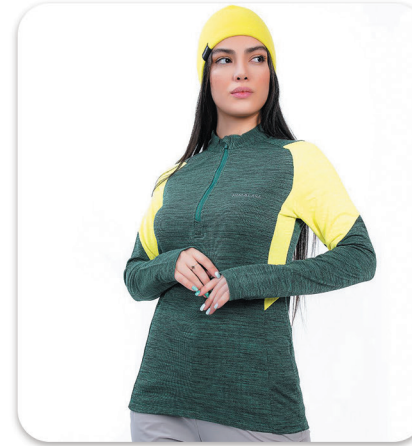
Women half zip blouse