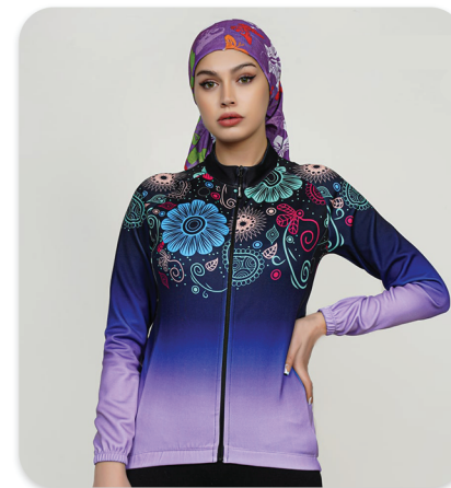
All Zipper Cycling blouse