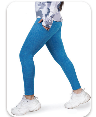
Legg Sports whit Two Pockets