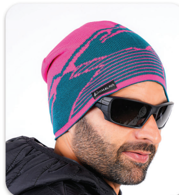
Mountain Designs Hat