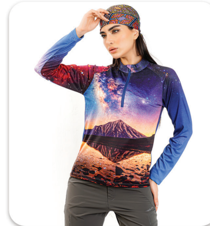
Damavand Half Zip