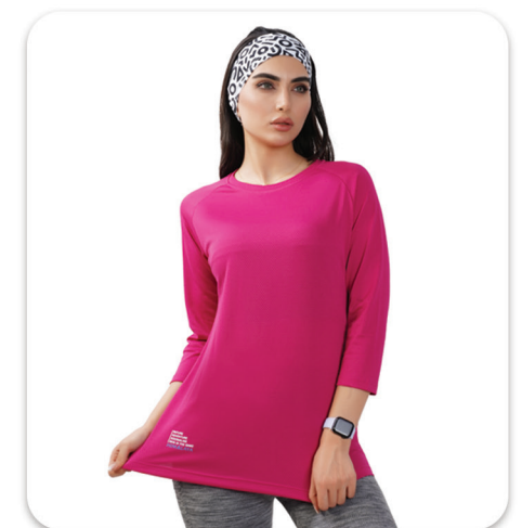
Round collar Blouse