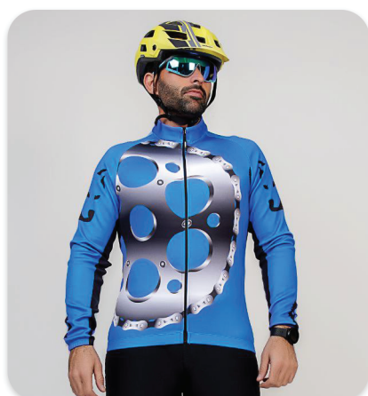
All Zipper Cycling blouse