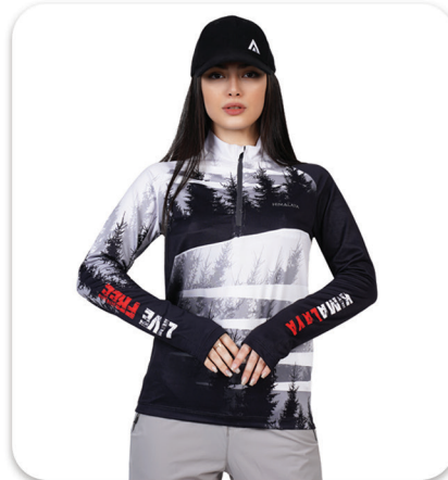
Live free Half Zip Blouse