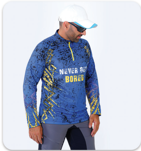
Blue Never Get Bored half Zip Blouse