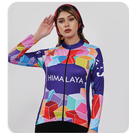
All Zipper Cycling blouse