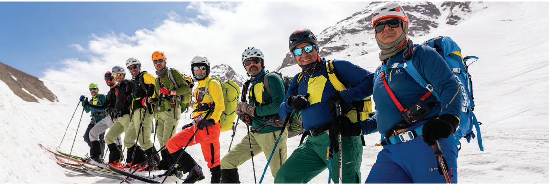
Code : 310492