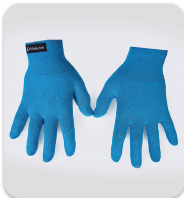
Code : 443