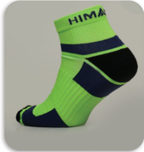
Code : 331 Running Socks