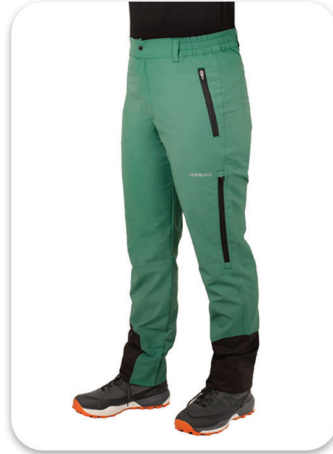
Legg Sports whit Two Pockets