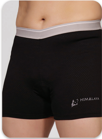
Padded Bicycling Shorts