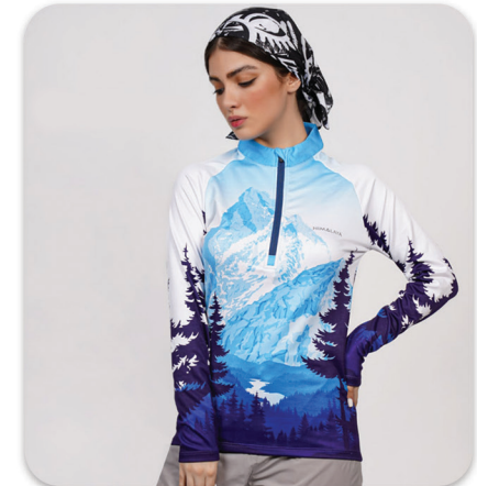
Round collar Blouse