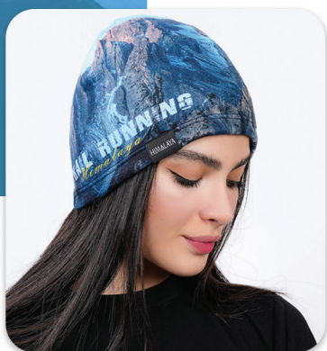
Runing Polar Hat