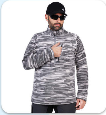
Guerrilla Design Polar Jacket