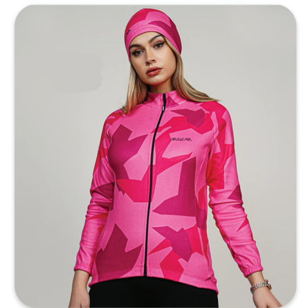
All Zipper Cycling blouse