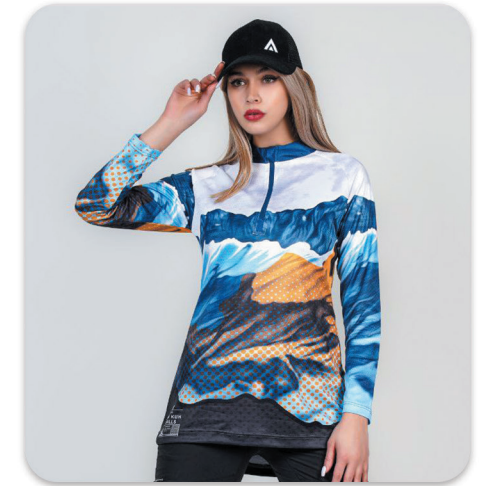
Alamkoo half zip blouse