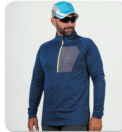
half zip blouse