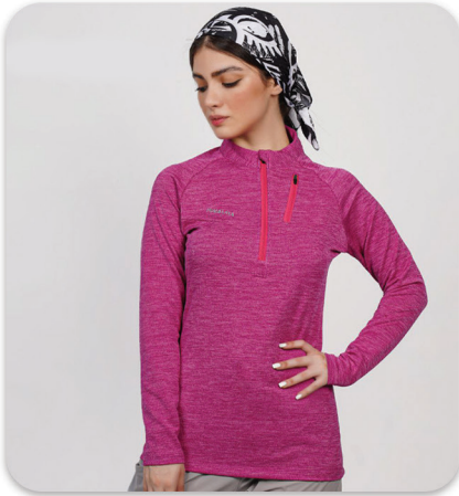
Half Zip Blouse