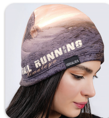
Runing Base Polar Hat