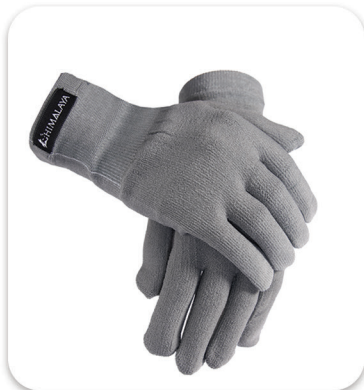
Code : 468