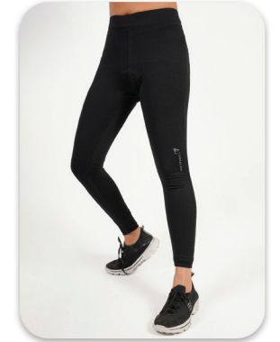
Cycling Legging with Pad