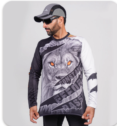
Lion LS Blouse