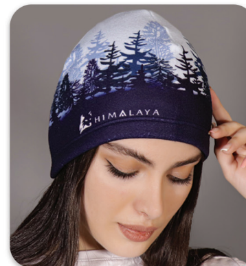
Maple Polar Hat