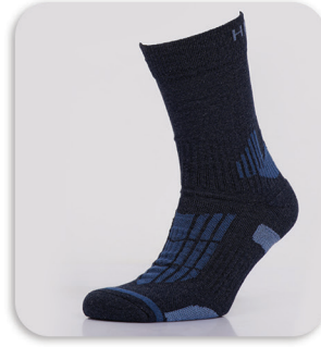
Code : 373 Mountaineering socks