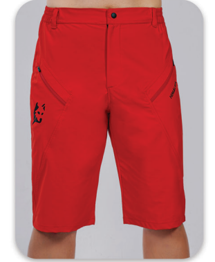
Wolf design short