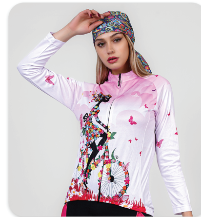
All zipper Cycling blouse