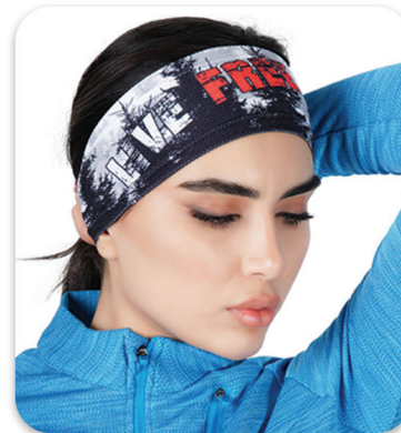
Code : 474