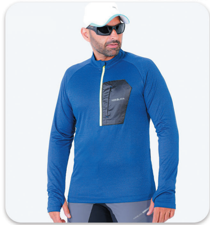
Men half zip blouse