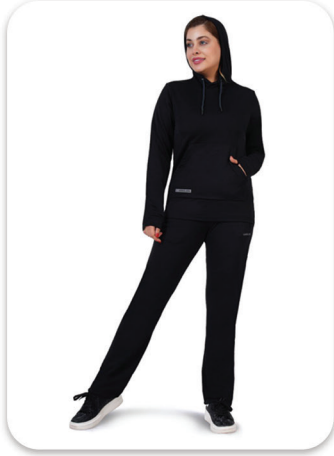
Hudy & Pants Micro