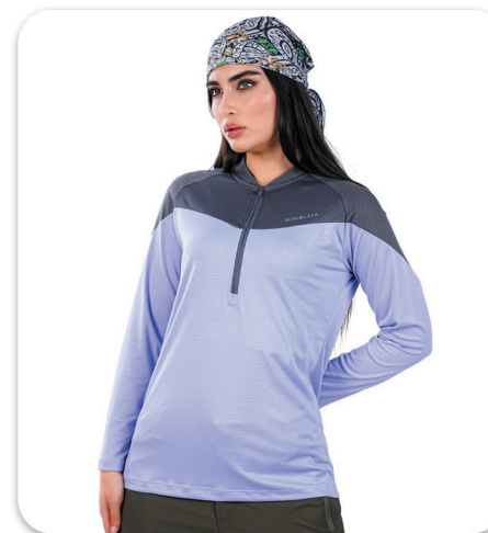
Women Half zip Blouse