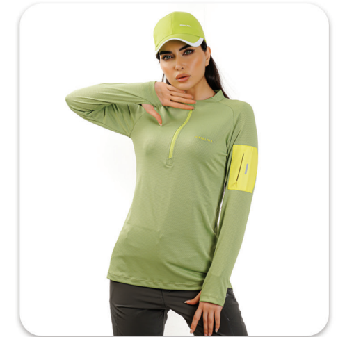
Women Half zip Blouse