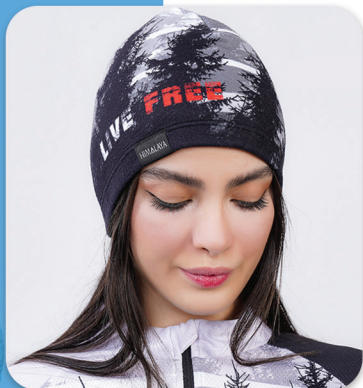
Live free Polar Hat