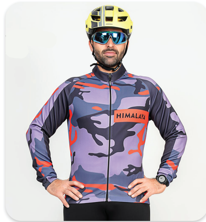
All Zipper Cycling blouse