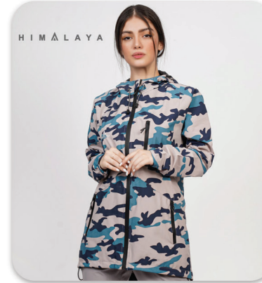
Guerrilla Waterproof Jacket