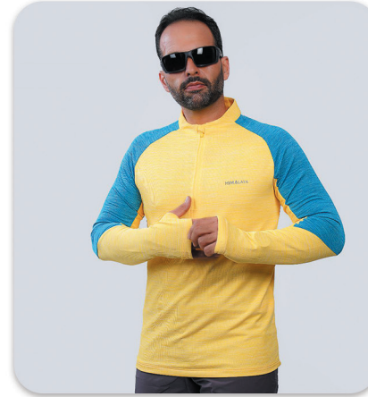
Men Half Zip Blouse