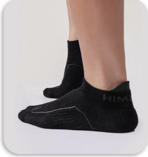
Code : 403 Daily Use