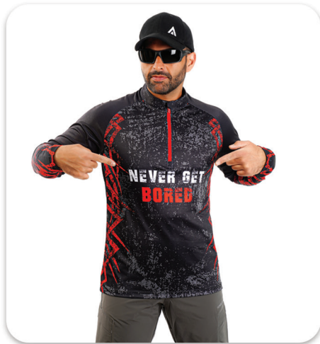
Red Never Get Bored half Zip Blouse