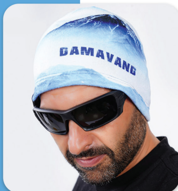
Damavand Polar Hat