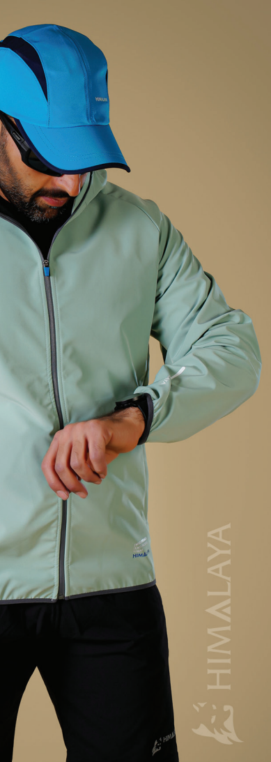
Code : 377