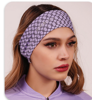
Code : 356