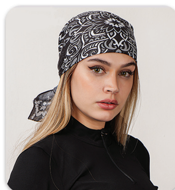
Code : 405