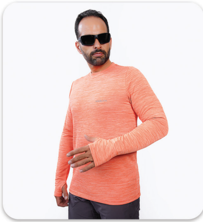
LS with finger & watch windows