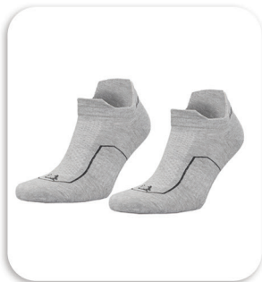
Code : 305469 Mountaineering socks