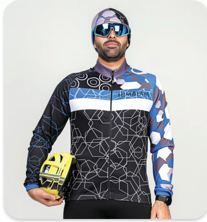
All Zipper Cycling blouse