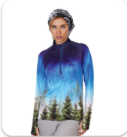
Forest half zip Blouse