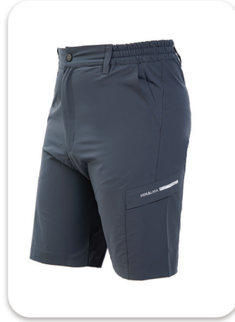
Wolf design short