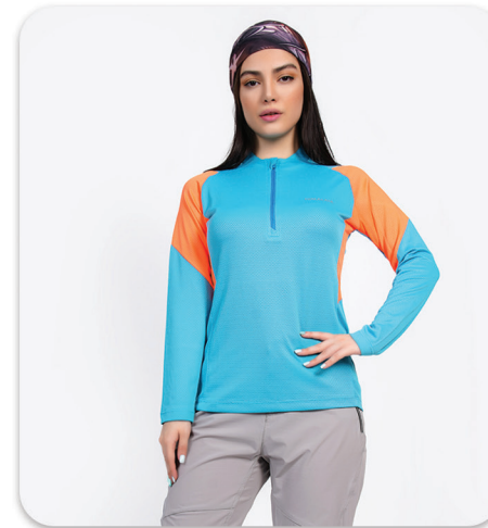
Women Half zip Blouse